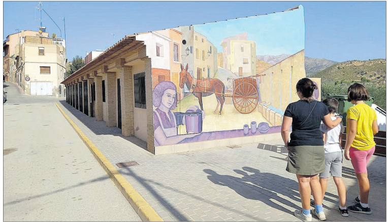
El mural pintado en un extremo del lavadero, que representa la fuente que hay al otro lado.

Con estos murales se muestra cómo era la actividad en torno a la fuente y el lavadero hace más de un siglo. El edil de Turismo, Francisco Iborra (PP), ha explicado que esta actuación se desarrolló en septiembre para poner en valor el lavadero, que está incluido en la Ruta de la Alfarería. Y la intención es en un futuro seguir poniendo en valor otros enclaves con murales similares, que sirven además de atractivo turístico para los visitantes.