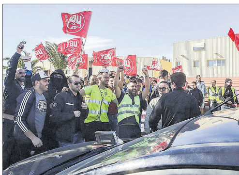
Movilización de empleados de Babcock en 2019.

El motivo de la movilización es la congelación de los sueldos y múltiples incumplimientos que denuncian del convenio de 2015, exigiendo unas «condiciones dignas» para los trabajadores de esta empresa, concesionaria de la mayoría de servicios aéreos de emergencias en España, resultante de la compra al fondo de inversión KKR de la com-